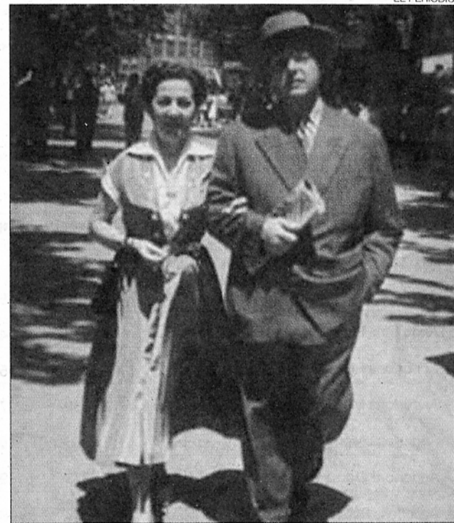
►► L'intel·lectual passeja amb la seva dona.